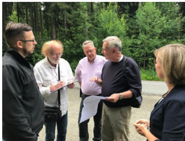
Impressionen der Evaluierung durch ICOMOS