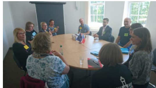
Impressionen von der Lehrerfortbildung und Workshops im Bergbaumuseum Oelsnitz.